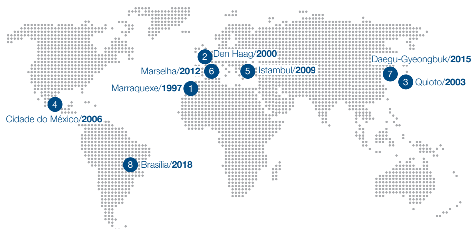
Eventos do Fórum Mundial da Água desde 1996

Para fortalecer e aprofundar o engajamento político, o Conselho trabalha com governos, parlamentares e parceiros para aumentar a visibilidade da água na agenda dos principais fóruns políticos multilaterais.